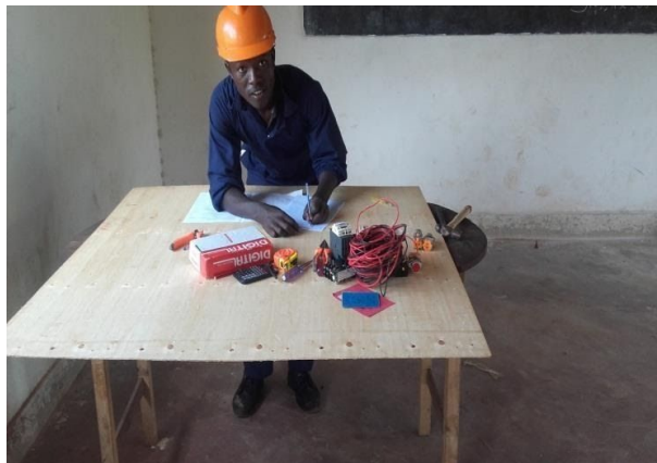
Electrical Students on a wiring board