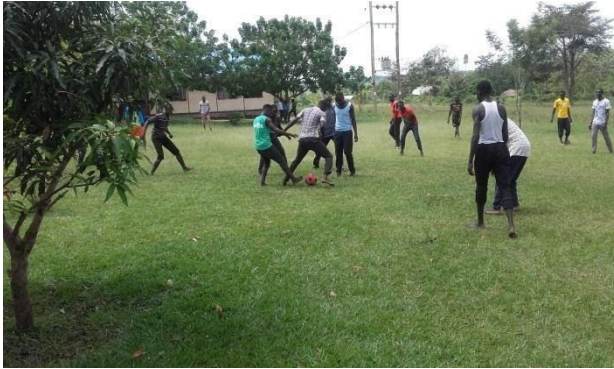
Students sports moments after lessons

Equal Opportunity, skilling boys and girls.