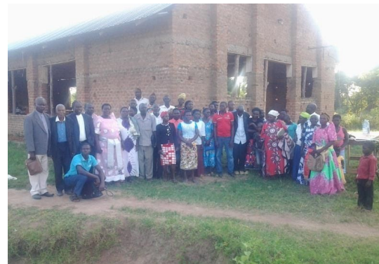
Picture of the church and christians after worship

We managed to provide a roof for our church building in the early part of the lockdown. Although the church is roofed, it's not really completed. It has no window and door frames, no glasses, no floor, no furniture and many other things are yet to be done to have the church building complete.