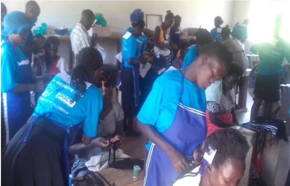
Hair Dressing Girls doing Hands Examinations In February 2020

We had a dead year in 2020. There were no national examinations at the end of the year as they have always been. However we managed to offer hands on assessments (examinations) for project students in February 2020.