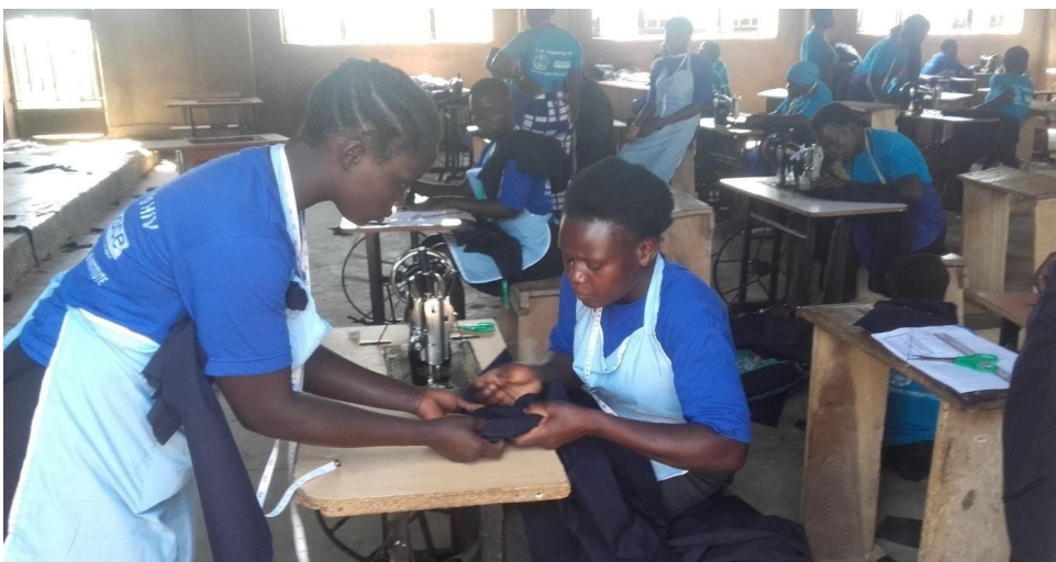
Tailoring Students doing Hands Examinations In February 2020

The above two groups of students are doing their examinations. All together they were 100 girls. They were sponsored by Melinda and Bill Gates Funds and Global Fund. They completed their courses in Hairdressing and Tailoring. The training was conducted in the localities where the girls live. These were all vulnerable girls: sick, poor and most of them single child mothers. Of those who sat examinations, one of them passed away in August 2020.