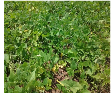
Beans garden, the crop about to ripen

We planted and harvested maize, beans, peas, sweet potatoes, cassava and others on small scales for domestic use. The balance of these food products were very useful for feeding students as students could not pay enough tuition to support them in the school.