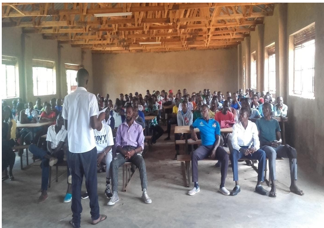
Students' assembly first week of school opening date before lockdown

During the tours we realised that students and parents are just ignorant. They are not given proper career guidance. Parents and students are used to traditional white collar and office career training. After several career guidance to several students and parents, enrollment into technical and vocational school is not increasing. Indeed, with more technical and vocational training, poverty eradication will become a reality much faster than when university entrances are reduced in favor of vocational/technical training.