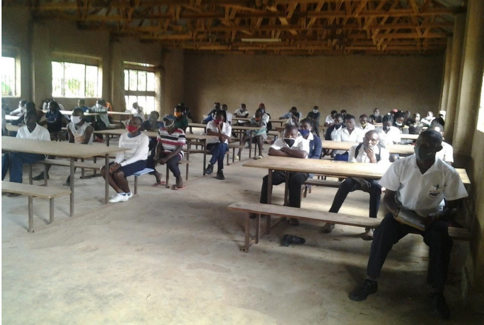
Students' Assembly in March 2020, maintaining social distancing.

People died of treatable diseases because they couldn't access health units since there were no transport systems. Motorcycle transports were banned except for cargo. Cars were not permitted to operate except ambulances and health ministry, police and military. These strict rules protected Uganda's population to the extent that only few deaths due to COVID 19 were recorded.