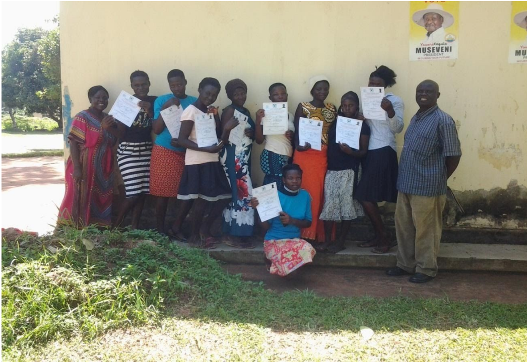
The directors handing over certificates to the Global Fund graduate girls at the later part of the year